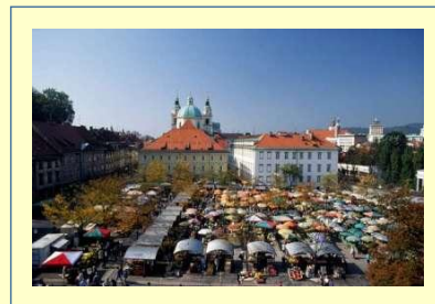
Comerțanții din piețele din Ljubljana au schimbat tolarul sloven cu moneda euro la 1 ianuarie 2007